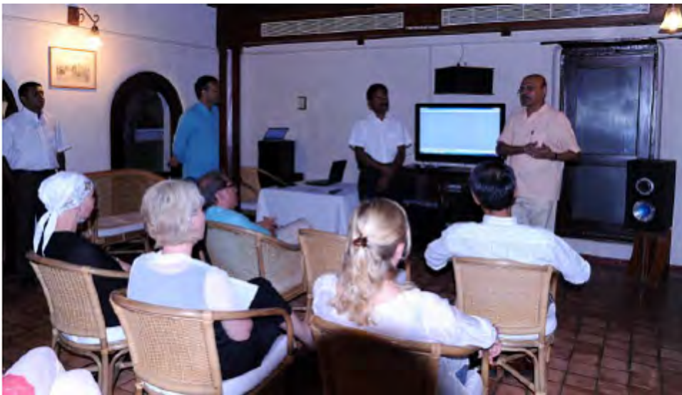
Orientering, innsalg og site inspections hørte med

Backwaters båttur , både på innsjø og i kanaler var- i alle fall for meg, et høydepunkt. Rolig duvende hvor du kunne sjå, føle og være en del av daliglivet langs kanalene, er noe som virkelig kan anbefales. Med egen kahytte om bord, egen kokk og trygg båtfører. Noe for en planlagt kjærlighetsreise og den som ønsker å komme nær det virkelige livet i denne delen av India. Taj hoteles er eid av samme store konsern og har en rekke hoteller også utafor India. Luksus i alle klasser og med vår valuta er det som de fleste steder i Asia , rimelig. Universiell utforming fullt på høyde med som er lovpålagt (-men ikke alltid i orden) i Norge, var slik det skal være merket jeg meg som svaksynt.